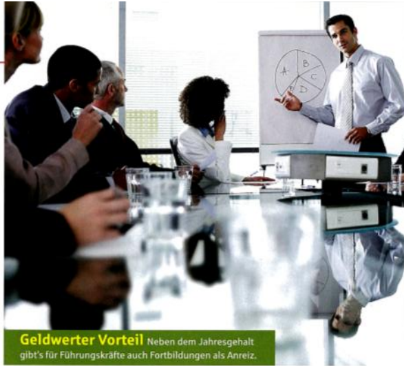
Geldwerter Vorteil Neben dem Jahresgehalt gibt's für Führungskräfte auch Fortbildungen als Anreiz.

Vor allem für Chefs einer inhabergeführten GmbH ist es wichtig, diese Bandbreite zu kennen. Denn sie genehmigen sich selbst ein Gehalt, das als Betriebsausgabe die zu zahlende Gewerbe- und Körperschaftsteuer senkt. Der Betrag